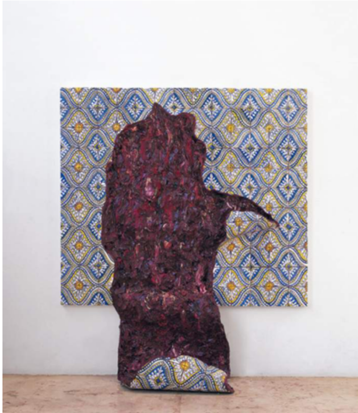
Figura 4: " Lingua com padrão sinuoso " (1998), de Adriana Varejão