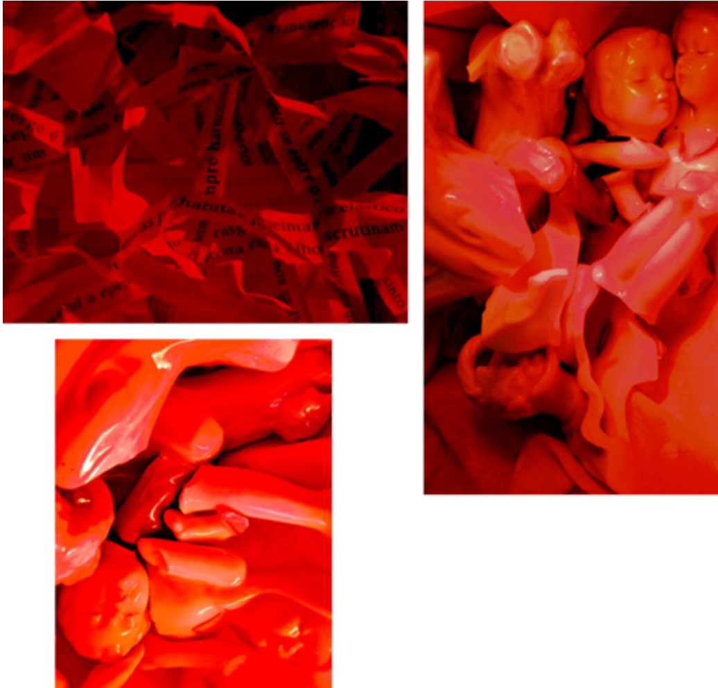
Figura 6 – Fotoimagens de Ana Mansur (2015)

Nas fotoimagens acima (figura 6), foi também explorada esta dimensão visceral. Necessariamente vermelhas, as composições são feitas a partir de fotos de esculturas de porcelana fragmentadas. Fotografadas com a iluminação de uma lâmpada vermelha, o brilho do material aliado às formas orgânicas dos corpos constrói vísceras quase elegantes. E não importa que os membros partidos estejam dispostos sobre o tronco. O caos precisa admitir que existe, ainda que não só através da tormenta. Apesar de ser possível captar lampejos de morte, não é unicamente a dor que impera, e nem poderia ser. Para o propósito poético investigado, é