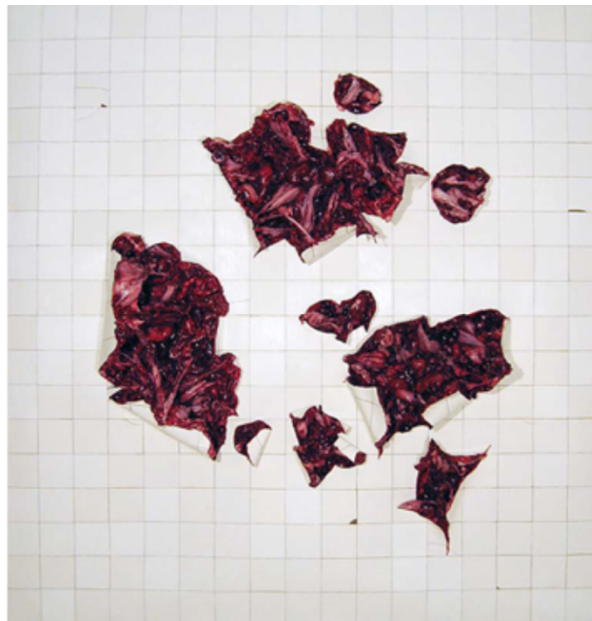
Figura 5 - " Folds " (2003), de Adriana Varejão