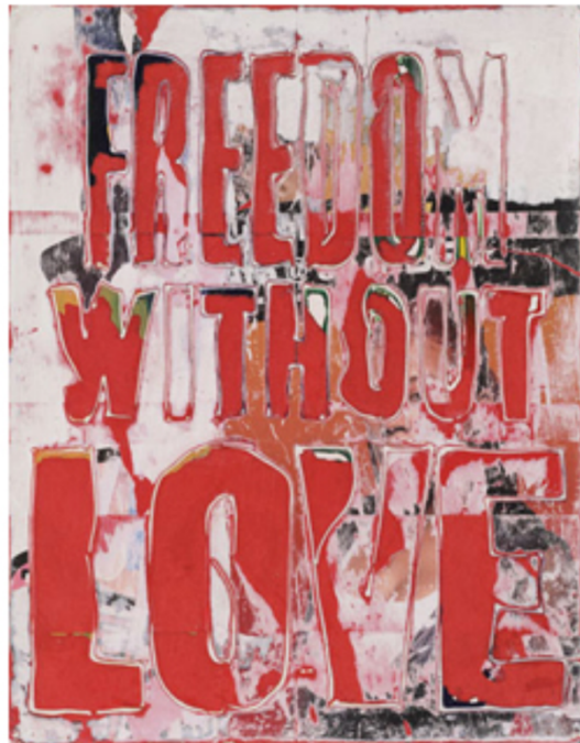
Figura 3 - Sem título (2009), de Mark Bradford

Uma abordagem semelhante foi utilizada por Mark Bradford, em sua obra de 2009 (figura 3), que traz um texto com vísceras gráficas, pois a essência escarlate que forma as palavras é obtida através de uma postura poética que admite as múltiplas camadas, evidenciando que as coisas não vistas estão carregadas de significado. O texto surge como residente “dentro” de algo, após ser desvelado sob a tela. Através de uma ação que não está representada na imagem, o texto floresce do interior da obra.