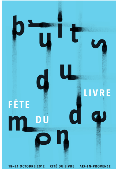
Figura 5: Bruits du Monde (2012), de Phillipe Apeilog.

A peça gráfica de Phillipe Apeilog faz parte da identidade visual criada para o Festival do Livro de Provença de 2012, intitulada de Bruits du Monde , em português, 'ruídos do mundo'. O cartaz é um exemplo de como a condução tipográfica, quando realizada de forma consciente, sozinha, é capaz de criar uma atmosfera que revela a essência de um projeto. O domínio estético do cartaz parte da atitude de Apeilog em saber quando e como subverter as regras tipográficas: mesmo com a aparente falta de ordem, o ritmo das letras ainda opera, não interferindo na legibilidade do cartaz. Como o projetista aconselha em uma de suas entrevistas "Aprenda a consentir e desobedecer" 1 .